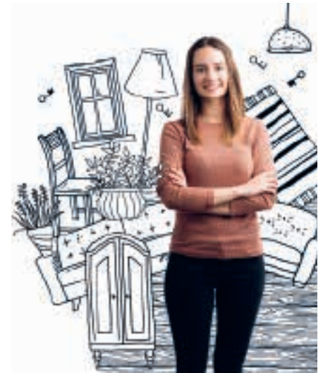
Rundum gut versichert

Die glarnerSach bietet individuelle und kostengünstige Versicherungslösungen für Privatpersonen, Firmen und landwirtschaftliche Betriebe. Profitieren Sie von einer persönlichen Beratung zu Ihrem massgeschneiderten Versicherungsschutz.