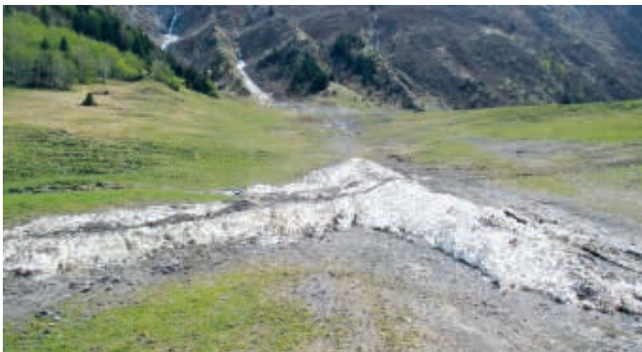
Lawinenschaden an Kulturland

Mit ihren Beiträgen unterstützt die glarnerSach nicht nur die Landwirtschaft bei der Behebung der Schäden, sondern leistet damit gleichzeitig einen wertvollen Beitrag an den Erhalt des Kulturlandes im Glarnerland.