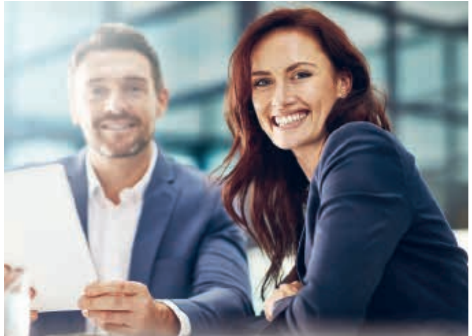
Geschäftsversicherung Profil: auf die aktuellen Bedürfnisse ausgerichtet

In Zusammenarbeit mit der CAP Rechtsschutz-Versicherungsgesellschaft AG wurde für das PROFIL eine eigene Betriebs- und Verkehrsrechtsschutz-Versicherung kreiert, die sich durch ein attraktives Preis-Leistungs-Verhältnis auszeichnet.