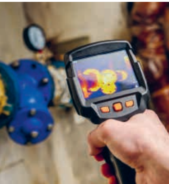
Ortung von Leitunglecks

Gebäude bergen Risiken, die sich trotz grösster Sorgfaltspflicht wie dem Einsatz vom Leck Puck nicht komplett verhindern lassen. Ein unerwartetes Leck der wasserführenden Leitungsanlage kann schleichend oder schnell einen ersichtlichen Schaden verursachen. Doch befindet sich das Leck auch tatsächlich beim festgestellten Wasseraustritt?